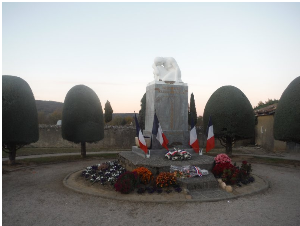
monument aux morts de Laroque d'Olmes (Vue de face)