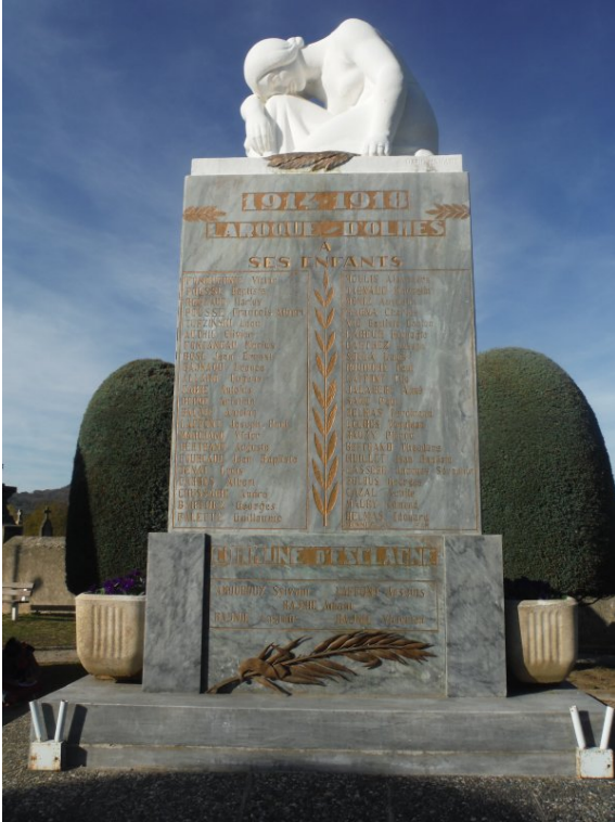
Soldats de la guerre 14-18 (Vue de face)