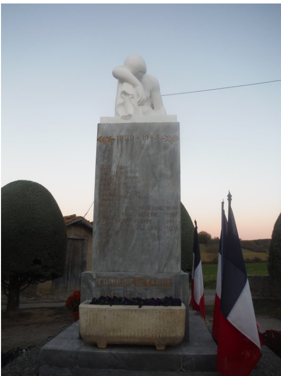
Soldats de la guerre 39-45 et autres guerres (Vue de profil)

© Copyright 2016, Angel, Oceane, Bianca, Ilham, Bryan,