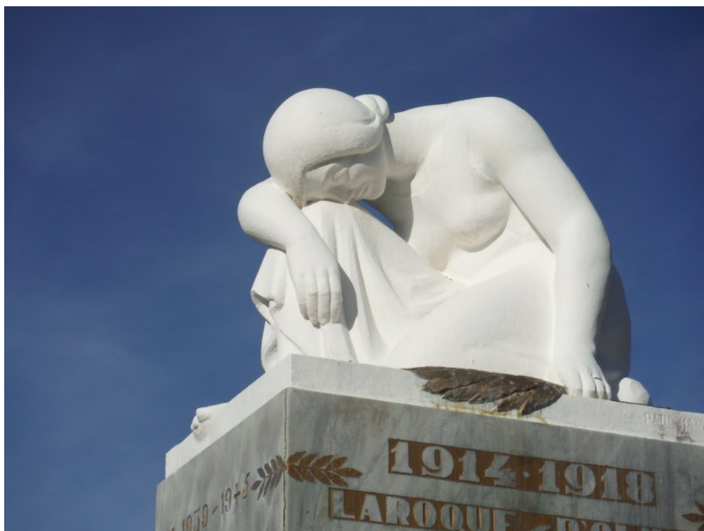
la pleureuse du monument (Vue de trois quarts)