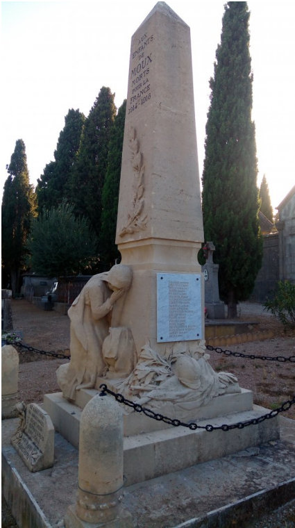
Photographie des sculptures (Vue de trois quarts)